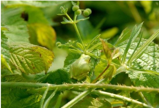
Boomkikker op braam – Marcel Bex